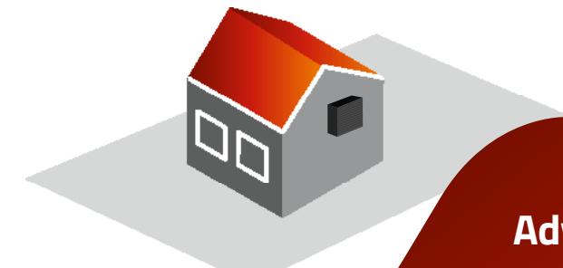
Aan de gevel