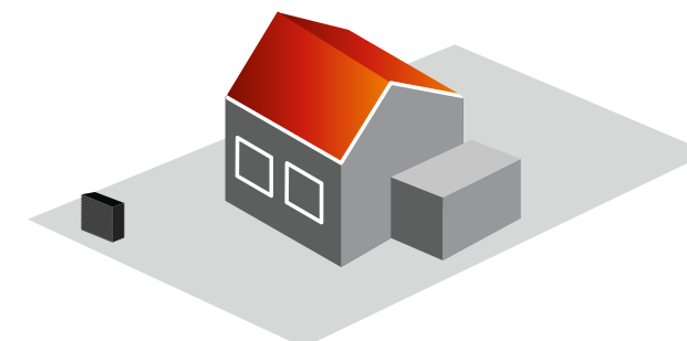
Achter in de tuin